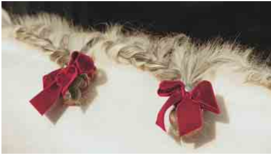
Liebe zum Detail: farblich zur Jacke des Reiters passende Schleifen schmücken beim Barockreiten die gezöpfelte Mähne des Pferdes. Im Bild Mayas Madrigal.