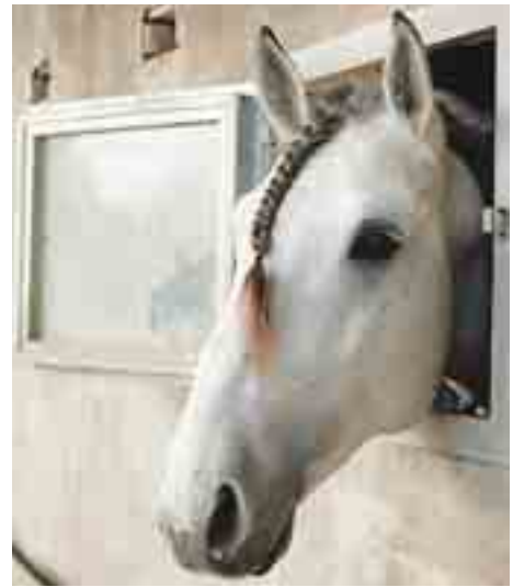
Neugierig: Der 5-jährige Lusitanohengst Sabedor.